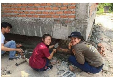
เรียนรู้ทฤษฎี คู่ปฏิบัติ

2.2 นิทรรศการภาพถ่ายกิจกรรมมหาวิทยาลัยและบรรยากาศทำงาน จากรุ่นพี่นักศึกษา