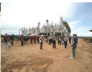
ศึกษาดูหน่วยงานจริง